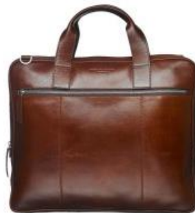
SLLs portfölj – svar på nya strategin för digitalisering