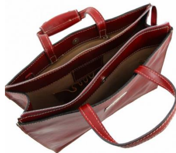
SLLs portfölj - svar på nya strategin för digitalisering