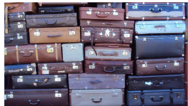
Kommunernas 26 portföljer