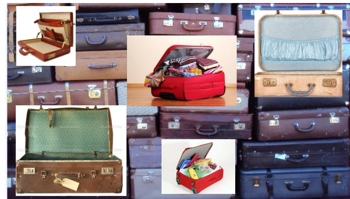
Kommunernas 26 portföljer