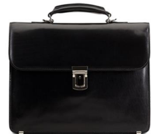
KSLs portfölj (gemensamma frågor, regionala projekt)