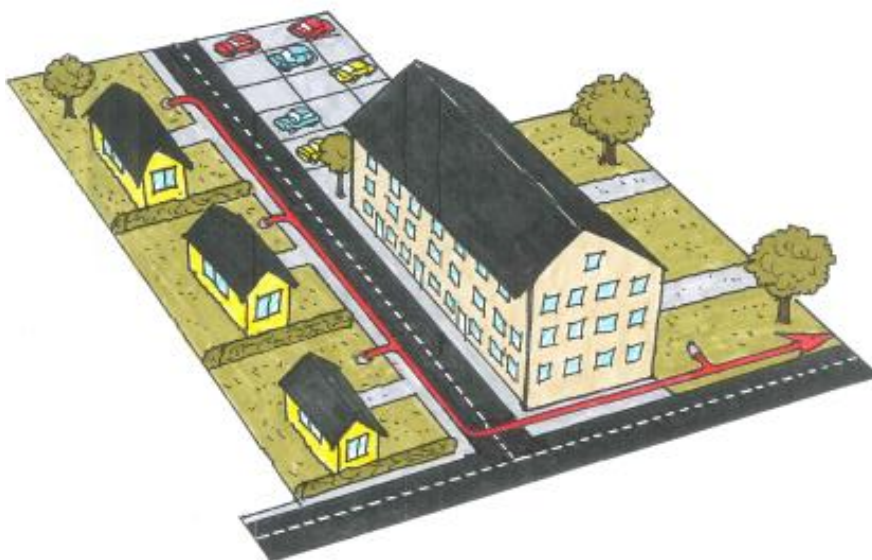
Bild 1: Bilden visar hur dagvattnet avleds i gemensam ledning (röd pil) för flera fastigheter inom detaljplan. Dagvattnet klassas därför som ett avloppsvatten enligt 9 kap. 2 § p 3 miljöbalken. Anmälningsskyldighet gäller för avloppsanordningen (ledning och/eller fördröjnings/reningsanläggning) om den avleder vattnet till mark eller recipient.